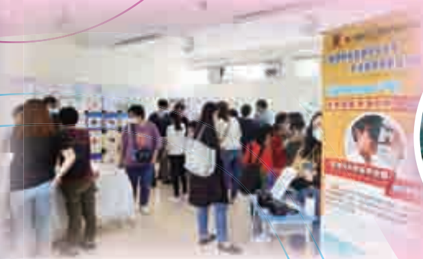
地理科：EduVenture®全球定位綜合戶外移動學習系統