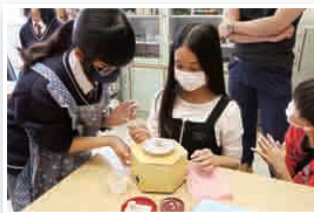
視藝科：迷你陶藝親子拉坯工作坊