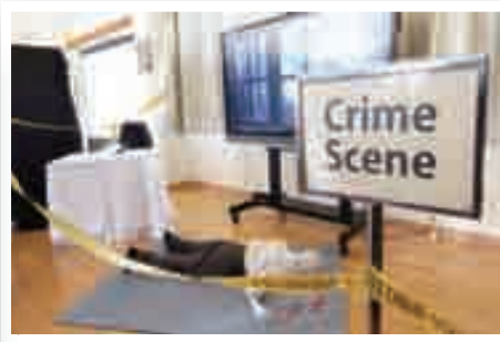
英文科：英語偵探「誰是兇手」