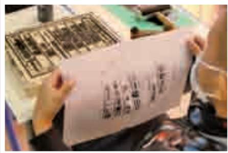
中文科：活字印刷工作坊