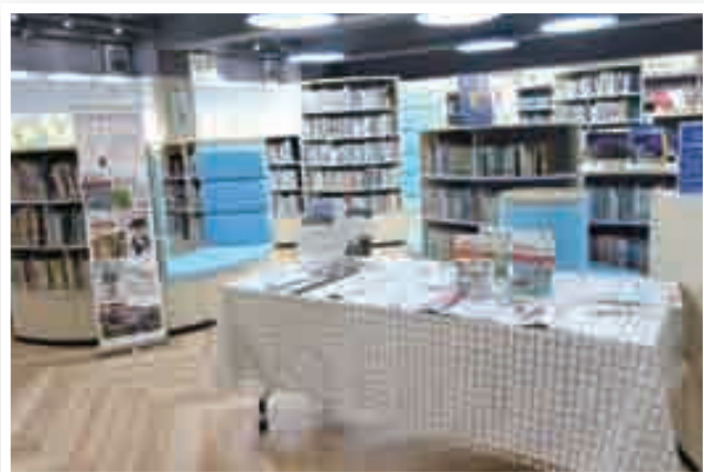
圖書館：外語閱讀遊戲(英、日、德)