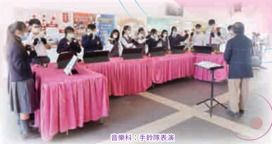
音樂科：手鈴隊表演