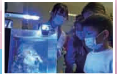
生物科：海底奇兵救救小珊瑚