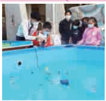
物理科：水陸兩用機械人