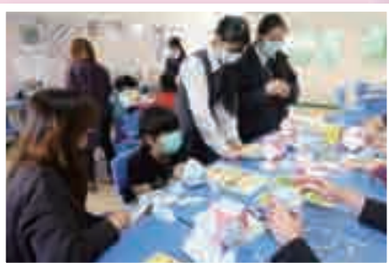
數學科：阿基米德立體製作工作坊