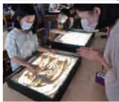
生涯規劃：沙畫工作坊