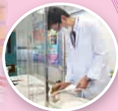
化學科：金屬的化學反應