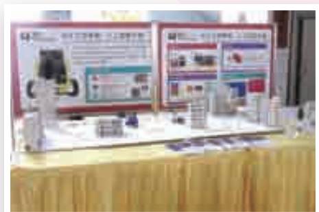
創新科技科：AI For the Future