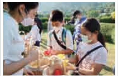
英文科：復活蛋競技解難 (學校天台花園)