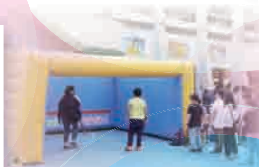
體育科：小型壁球體驗