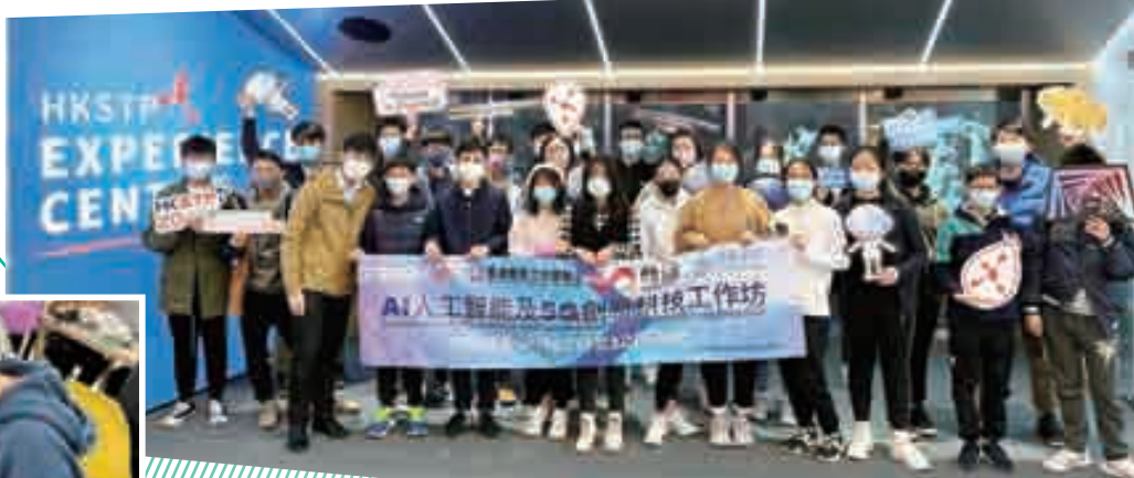
活動尾聲，同學在科學園新設的創科體驗館，參觀首個藝術科技展覽「《人·造》：現代科技與傳統文化的交匯」。以自然處理語言技術留下對科學園的企業願景，結束豐富的學習旅程。