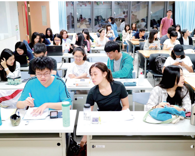
「寶島創創」比賽，規定同學需要上「數位行銷課」（類近電子商貿），上課內容包含教授如何撰寫企業計劃書和架設網站、以及運用Line和Facebook專頁行銷等