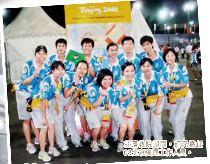
就讀教院期間，師兄擔任 08北京奧運工作人員。