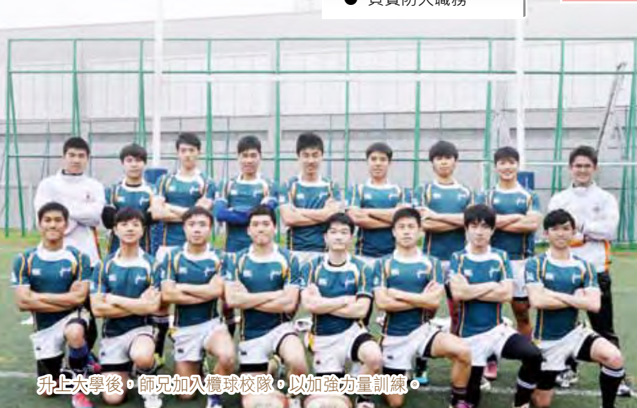
升上大學後，師兄加入欖球隊，以加強力量訓練。