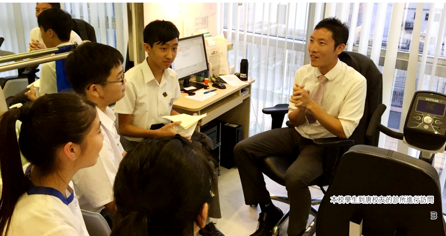
本校學生到唐校友的診所進行訪問