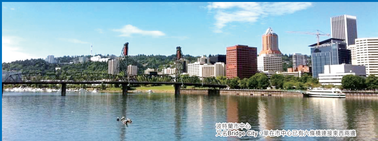
波特蘭市中心 又名Bridge City，單在市中心已有六條橋連接東西兩邊

但美國的醫學教授非常強調，「人」永遠是一個整體。大部分的創傷和痛症都是與日常生活習慣有關，所以前線醫護人員必須有技巧地向患者提問，掌握最全面資訊，從而分析問題所在。這樣方能找出準確的傷患處，杜絕痛楚根源。