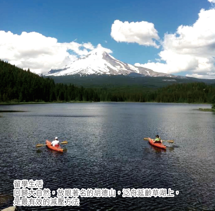
留學生活 回歸大自然，放眼著名的胡德山，泛舟延齡草湖上， 是最有效的減壓方法